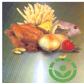
Esquema 1. Logotipo de alimento irradiado

Trazadores. Graves problemas en el campo de la agricultura se han solucionado gracias a los isótopos radiactivos, llamados por los investigadores trazadores, los cuales han permitido detectar problemas, mejorando la cosecha y nutrir de forma más efectiva el ganado. Los isótopos son medios ideales para estudiar el comportamiento, la distribución y los residuos de los productos agroquímicos en el suelo, el agua, las plantas, los animales y sus productos. Como resultados de la utilización de los isótopos en la investigación agrícola, ha sido posible concebir las plagas y promover el crecimiento de las plantas. Como la planta no distingue entre los elementos provenientes del fertilizante y los del suelo natural, es posible medir la cantidad exacta de nutrientes de fertilizantes captados por la planta.